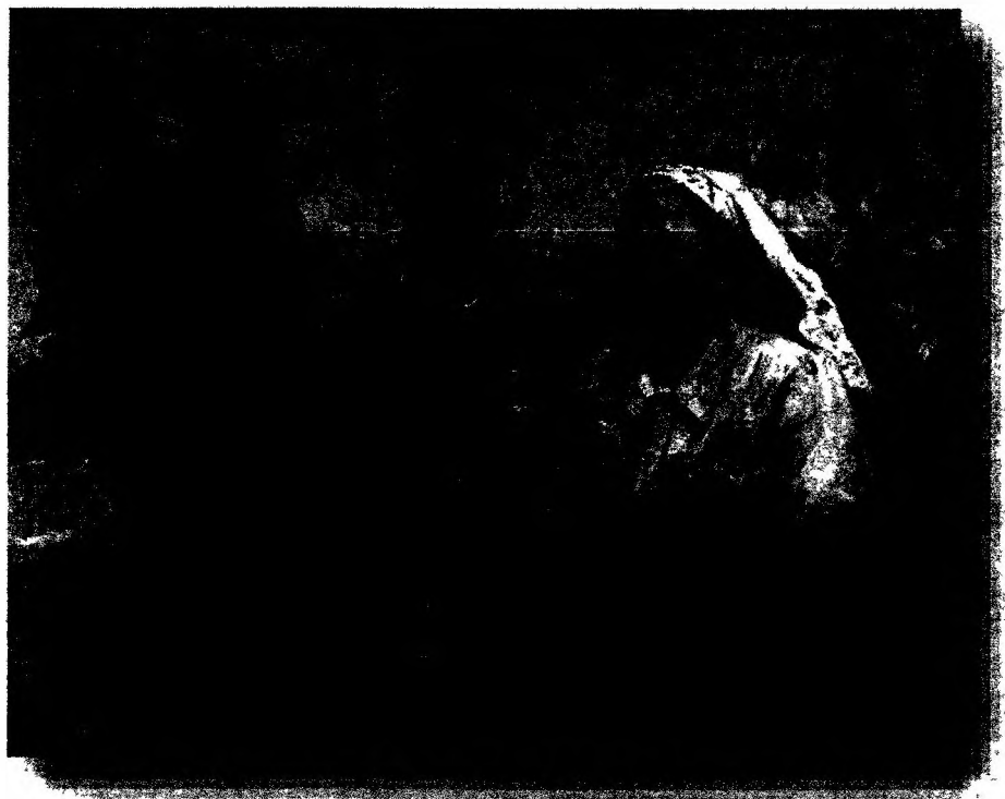
«Герои Социалистического труда», 1951 г.

К началу 1977 года звание Героя Социалистического Труда было присвоено 18 287 советским гражданам , из которых свыше ста человек награждены двумя медалями «Серп и Молот».