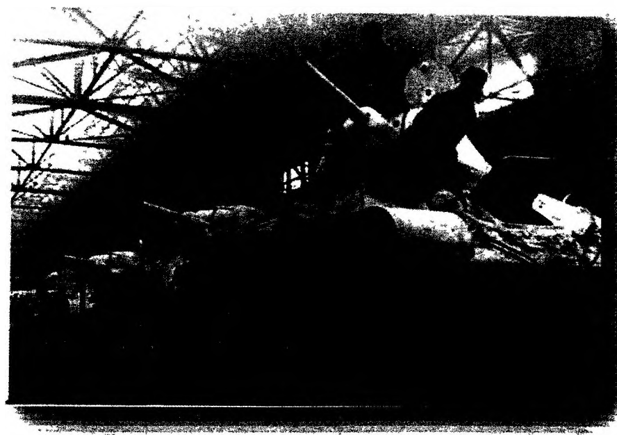
T-34 на жд-платформах