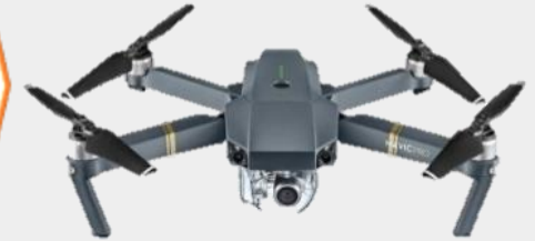
БпЛА КТ (тяжелые)